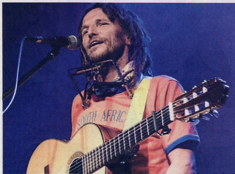
Für 800 Euro bei Ebay versteigert: Auf dem Foto trägt Hans Söllner Dreadlocks, später hat sie ein Fan für ein kleines Vermögen gekauft.

Der örtliche CSU-Bürgermeister hat das Auftrittsverbot so begründet: „Auf der einen Seite lassen wir uns als Deppen und Nazis beschimpfen, auf der anderen Seite will er bei uns Reibach machen.“ Die alten Reflexe funktionieren noch immer. Nicht jeder hat Sympathie für den Hofnarren, muss man ja auch nicht haben. Aber eines ist auch klar: In 50 Jahren wird man noch über diesen verwegenen Mann sprechen. Weil bei Revoluzern ist es wie bei Heiligen: Irigendwann gehören sie dazu, in diesem Fall zu Bayern.